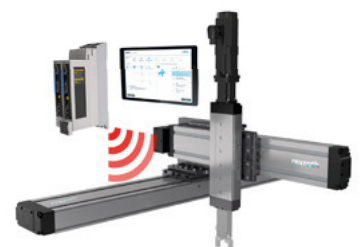
Smart Function Kit for Handling

Wie Smart MechatroniX Ihren Wettbewerbsvorteil voranbringt? Hier eine knappe Zusammenfassung: